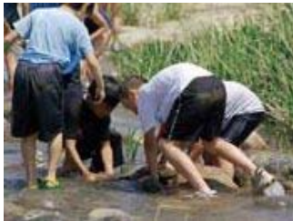
▲庄川探検に出かけました。石をめくると、小さな生き物がいました。