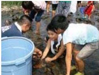
▲地域の行事「アユのつかみどり」に参加しました。