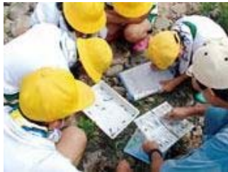
▲水生生物調査を行いました。庄川の水はきれいだと分かりました。