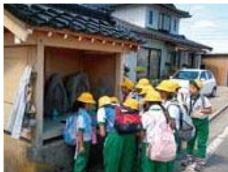
▲「庄南なかよしウオーク：庄川の昔探検」庄川のていほう沿いにつくられた、たくさんのお地蔵様や観音様を見て歩きました。