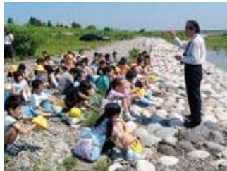
▲公民館館長さんから昔の庄川の遊びや洪水のお話を聞きました。