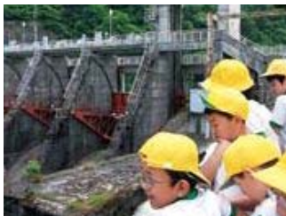
▲庄川用水合口ダムに見学に出かけました。