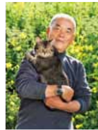
い わ ご う み つ あ き 岩合光昭